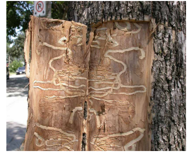
▲ Galeries creusées par les larves.