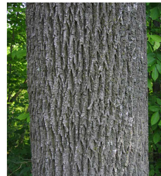
▲ Écorce d'un frêne blanc.