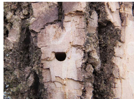
▲ Trou d'émergence.