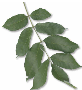
▲ Feuilles d'un frêne rouge.

L'agrile du frêne attaque et tue toutes les essences de frênes ( Fraxinus spp. ), que les arbres soient sains ou affaiblis. Les jeunes frênes ne sont pas épargnés, puisque les tiges dont le diamètre est aussi petit que 2,5 cm (1 po) peuvent être attaquées.