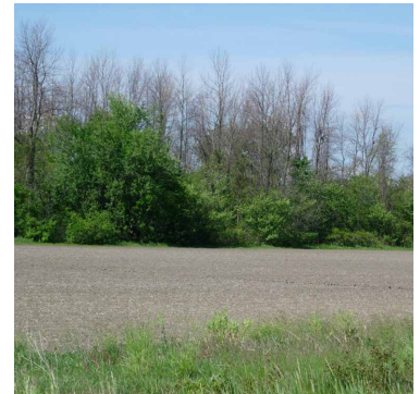
▲ Arbres infestés en milieu boisé.