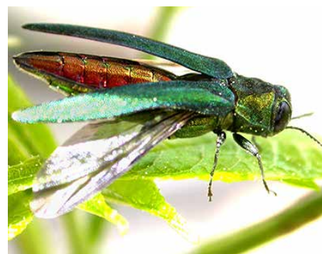
▲ Agrile du frêne adulte dont les ailes sont déployées, permettant d'observer la couleur rouge cuivrée du corps.

Au Québec, l'agrile du frêne complète son cycle vital en une ou deux années.