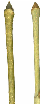
▲ Rameaux d'un frêne noir.