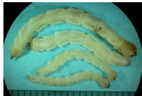
▲ Larves de l'agrile du frêne.