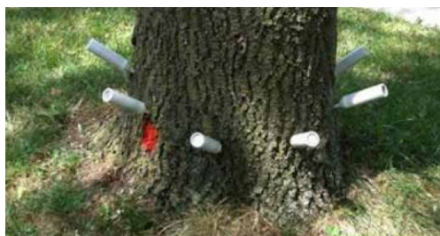
◀ Traitement administré à un frêne.